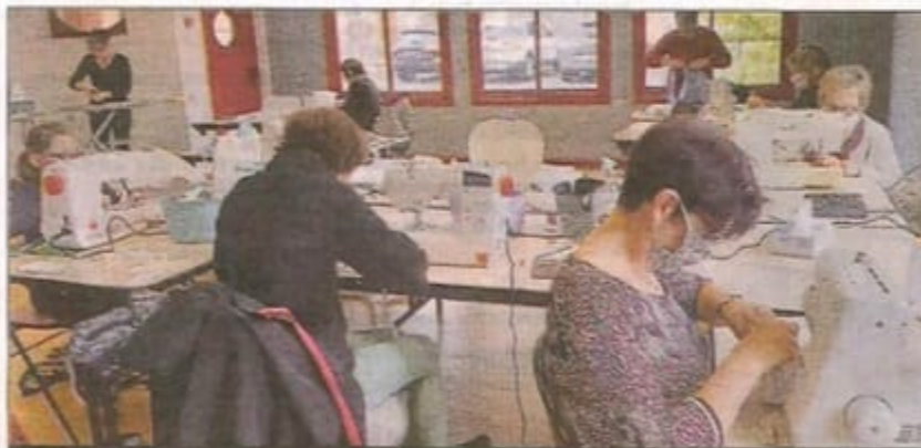
FABRICATION. Les petites mains soumanaises sont au travail pour confectionner des masques.

Alors que depuis des semaines on assiste aux tergiversations des pouvoirs publics concernant la distribution de masques de protection, la solidarité s'organise à Soumans derrière les machines à coudre.