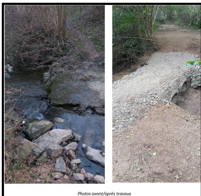
Photos avant/après travaux