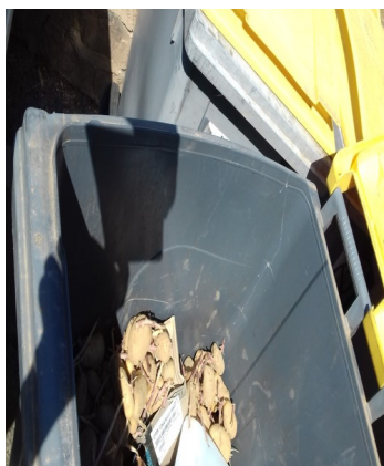
photo ou par tous les défauts de tri, je leur demande d'arrêter ce type de comportement et j'espère que leur conscience leur fera honte.

On pourrait se dire que ça se passe de commentaire : eh bien non ! Je vais juste essayer de vous sensibiliser face à ce type d'incivilité qui ne concerne pas que les pommes de terre, hélas non, mais bien tous les défauts de tri qu'on déplore semaine après semaine. Ce n'est pas que de l'étourderie, ça traduit un profond manque de respect vis-à-vis du personnel des centres de tri et, au-delà, vis-à-vis de nous tous. Aussi, à tous ceux qui sont visés par cette